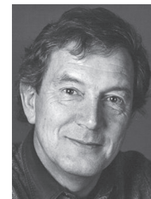
de Michel Bühler